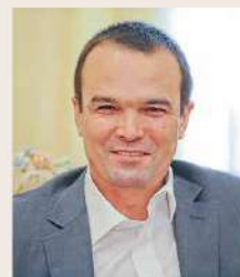
Михаил Игнатьев, Республика Чувашия

13 января 2020 года, в профессиональный праздник День печати, член партии, член регионального политического совета Чувашского регионального отделения партии, глава Республики Чувашия (29.08.2010–29.01.2020) Михаил Игнатьев в своем официальном обращении к журналистам республики призвал «мочить» тех блогеров и журналистов, которые только критикуют власть. «Некогда будет заниматься благоустройством дворовых территорий, общественных пространств, открывать новые производства. Будем заниматься только разборками», – добавил он. 19 января 2020 года заместитель секретаря Генерального совета партии, ответственный секретарь Комиссии партии по этике Евгений Ревенко призвал Михаила Игнатьева извиниться и объяснить свою недвусмысленную позицию журналистам, однако Михаил Игнатьев не счел нужным извиняться.