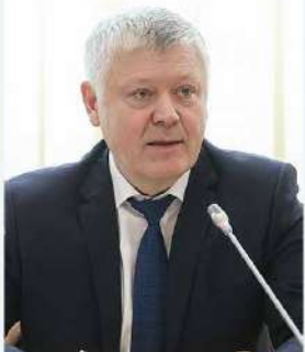
Депутат Государственной думы РФ, председатель комитета по безопасности и противодействию коррупции, член Высшего совета партии «Единая Россия», заместитель председателя Комиссии партии по этике В. И. Пискарев

«Политическое лидерство накладывает повышенные требования, что обязывает нас придерживаться принципа личной скромности и сдержанности в обществе. Каждый, кто говорит от имени партии, должен быть ответственен за каждое слово и не допускать высказываний, унижающих достоинство людей».