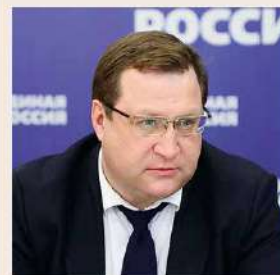
Дмитрий Юрков, Архангельская область