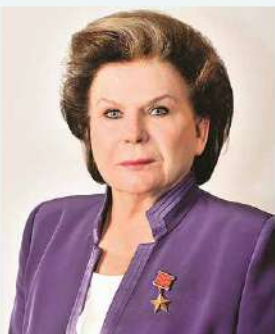
Герой Советского Союза, депутат Государственной думы РФ, член Высшего совета партии «Единая Россия», председатель Комиссии партии по этике В. В. Терешкова

«Политическое лидерство накладывает повышенные требования, что обязывает нас придерживаться принципа личной скромности и сдержанности в обществе. Каждый, кто говорит от имени партии, должен быть ответственен за каждое слово и не допускать высказываний, унижающих достоинство людей».